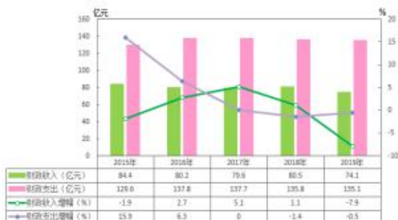
图 7 2015 年-2019 年全区地方财政收支及增幅情况

调整优化结构，确保全年收支平衡。全年全区实现地方财政支出 135.1 亿元，增长 -0.5 %。一般公共预算支出 100.4 亿元。严格落实中央减税降费政策，新增减税降费约 57.7 亿元，新增减税规模位居主城九区第一。开展“六圈一园”税源清理、加快行政事业单位国有资产处置和土地出让进度等方式，多措并举弥补政策性减收。区级各部门按不低于 5% 的比例压减部门一般性项目支出 8159 万元，全面缓解区级财政收支矛盾压力。从教育、医疗、交通等方面对鱼复五等农村地区予以财政资金安排；全年投入 21.9 亿元用于教育、社保、就业、卫生等基本民生支出；落实人居环境整治 5000 万元，加强困难群众的住房安全保障。