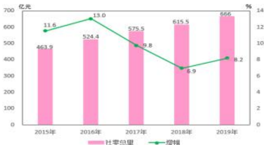
图 6 2015 年-2019 年全区社会消费品零售总额及增幅情况

遗余力打造“不夜九街”和“嘉嘉码头”两个特色夜市街区，努力推动商贸向多态融合转型升级。国金中心累计引进国际品牌 80 余个，重庆首家“动态体验式”购物生活空间天和里购物中心正式营业，永辉超市携手腾讯共同打造的新零售综合体——“超级物种”，京东全球最大的无界零售超级体验店落地寸滩保税港并正式营业。全年累计举办各类会展促销活动近 50 场。成功承办商圈购物节、火锅节等市级大型展会，吸引市内及周边省市市民体验消费，火锅节已连续 4 年在江北区举办。指导大型商贸企业重百电器、苏宁电器、居然之家等商业企业开展了家用电器及家居建材等各类会展促销活动。