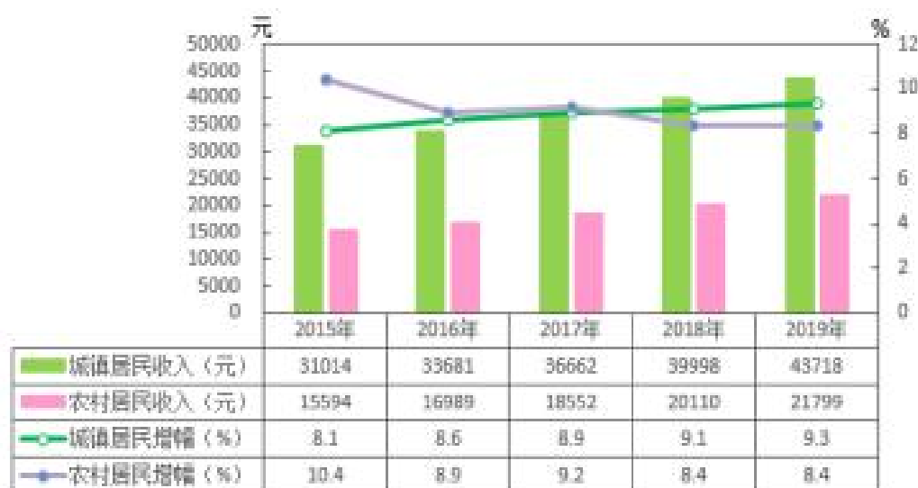
图 8 2015 年-2019 年全区城乡居民收入及增幅情况

收入 21799 元, 增长 8.4%。二是民生保障更加有力。区级财力 50% 以上投入民生事项, 全面完成 14 件区级民生实事, 建设民生项目 230 个, 让人民群众的获得感、幸福感、安全感更加充实、更有保障。城镇新增就业 5.1 万余人, 城镇登记失业率控制在 2.5% 以内。推进“治欠保支”, 保障农民工合法权益。认真落实“两不愁三保障”, 积极推动农村和城镇危房改造, 在全市率先实现失能、半失能特困人员 100% 集中供养。建立退役军人服务保障体系, 被评为“重庆市退役军人工作模范单位”。三是社会环境安定有序。坚决打好防范化解重大风险攻坚战, 全力做好防风险保安全护稳定迎大庆工作, 纵深推进扫黑除恶专项斗争, 扎实推进社会治安综合治理, 刑事类、治安类警情持续下降, 实现敏感案事件等“八个零发生”。稳步推进国家食品安全示范城市创建, 生产安全基本面持续改善, 全年未发生较大及以上生产安全事故。