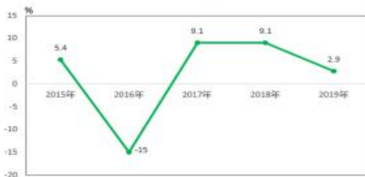
图 5 2015 年-2019 年全区固定资产投资增幅情况

房地产投资保持稳定。2019 年出让土地 260 亩，比 2018 年减少 132 亩，实现土地出让价款 24.7 亿元，比上年同期增加 6.2 亿元。2019 年全区房地产开发投资额增长 3.8%。住宅、办公楼、商业营业用房完成投资分别增长 11.2%、-35.4%、2.6%。