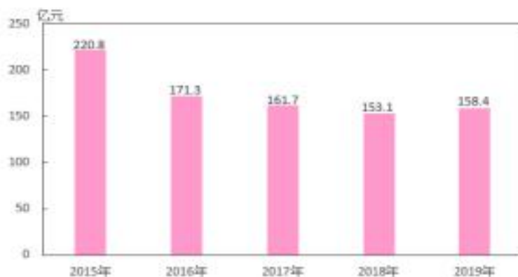
图4 2015年-2019年全区建筑业总产值情况

2019年，全区建筑业实现增加值63.3亿元，增长5.2%。全年纳入企业一套表的建筑业企业68家，实现建筑业总产值158.4亿元，完成施工面积708.6万平方米，竣工面积194.3万平方米。